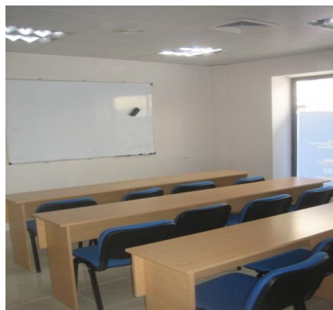
Aula 1 (Capacidad para 12 personas)