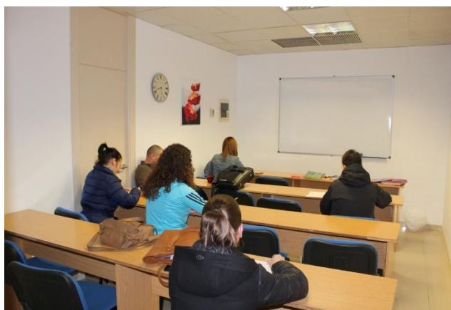
Aula 4 (capacidad para 16 personas)

Disponemos de un centro amplio, adaptado a personas con movilidad reducida y bien iluminado. El centro se divide en cuatro aulas con distintas capacidades según la necesidad.